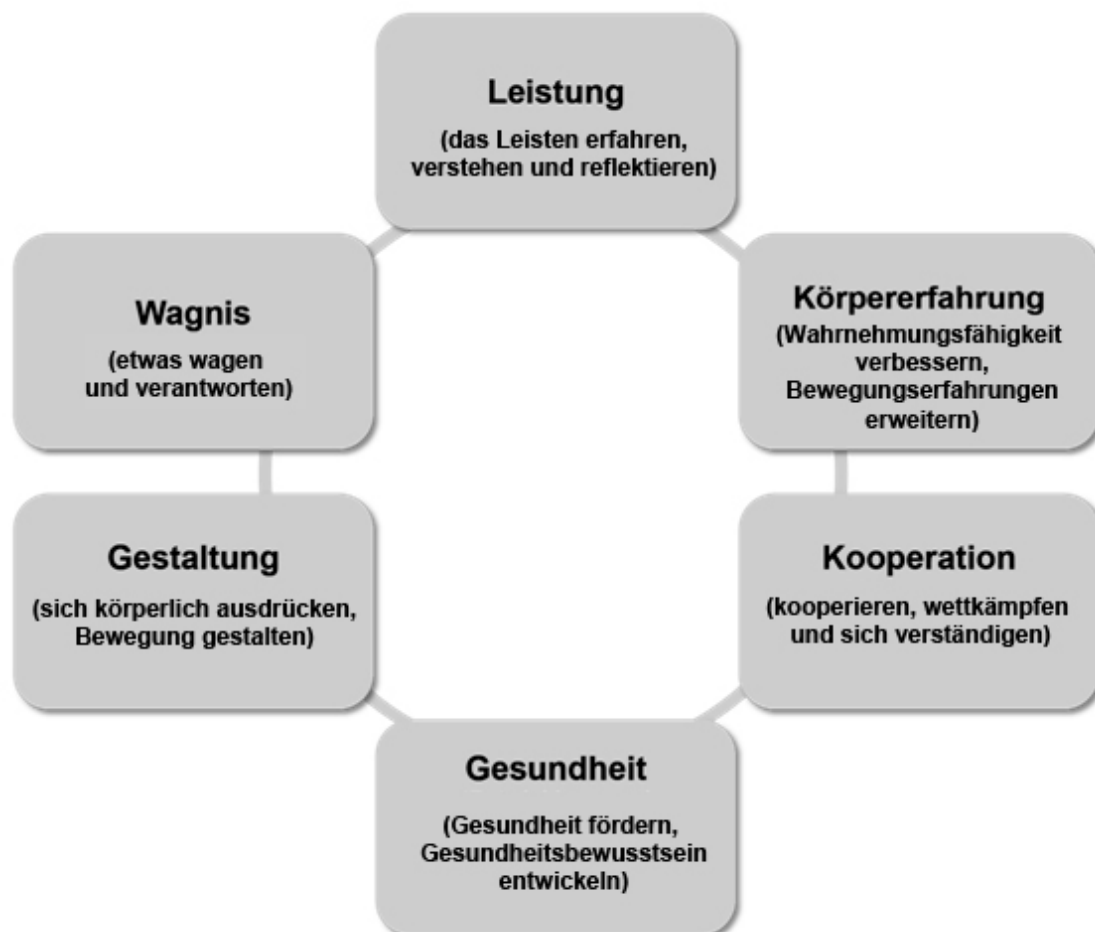
Abb. 1: Pädagogische Perspektiven

Die Auswahl, Gewichtung und Verknüpfung der pädagogischen Perspektiven erfolgt durch die Lehrkraft auf der Basis der Festlegungen der Fachkonferenz.