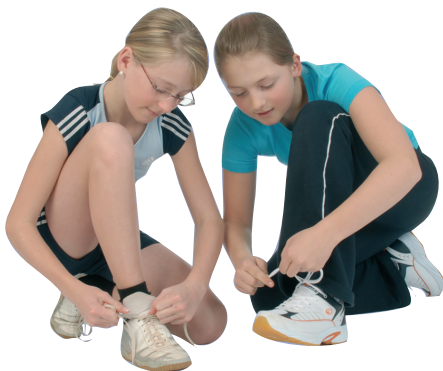
Ideal für den Sportunterricht: Universal-Hallen-Sportschuh (Schulsportschuh)

Sportschuhe, die man im Sportunterricht in der Halle trägt, sollen nicht auf der Straße getragen werden. Sie bringen sonst Schmutz in die Sporthalle, erhöhen dadurch das Unfallrisiko (Rutschgefahr) und die Gefahr der Verbreitung von Krankheitserregern. Wird der Hallensportschuh im Freien benützt, ist vor der weiteren Nutzung in der Sporthalle eine gründliche Reinigung des Schuhs erforderlich.