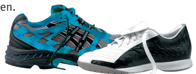
Joggingschuh / Universal-Hallen-Sportschuh

Man sollte sich beim Kauf also gut beraten lassen und die Möglichkeit nutzen, qualitativ hochwertige Auslaufmodelle preisgünstig zu erwerben.